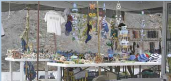
Los puestos de artesanía de El Mirador son un atractivo más para el visitante.

Las personas de San Carlos y de sus alrededores, son trabajadoras, amables, gentiles y tienen una orientación muy fuerte hacia la familia.