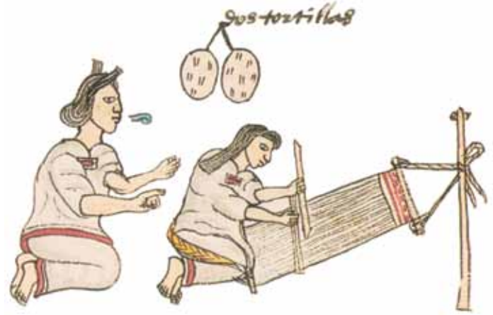
La pictografía nos muestra a una jovencita tejiendo en telar de cintura, en tanto una mujer adulta la supervisa y le confiere consejos; en la parte superior se observan dos tortillas, las cuales aluden a la ración a la que tenía derecho. Códice Mendocino foja 60r.

El valor social conferido a las labores textiles no sólo era a nivel familiar, sino que se halla expresado en la retórica de los gobernantes, quienes en sus discursos mencionaban, metafóricamente, que su hablar nunca podría crear cosas tan bellas como lo hace el malacatl y el tzotzopaztli . Los consejos serían reiterativos en cada etapa de la vida de la mujer, primeramente las exhortaciones eran para encausar y alentar a las niñas hacia las labores textiles, posteriormente los consejos buscaban que la mujer no abandonara esta actividad y buscara dominarla a la perfección, como lo describe Alonzo de Zorita: "Ten cuidado de la