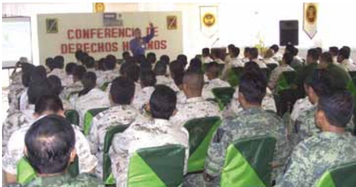
La capacitación de la CEDH en las sedes militares de la Sedena ha abordado distintas clases respecto al conocimiento de temas referentes a derechos humanos.