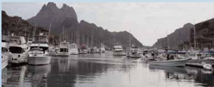
La Marina , un lugar para disfrutar el clima y los atardeceres.