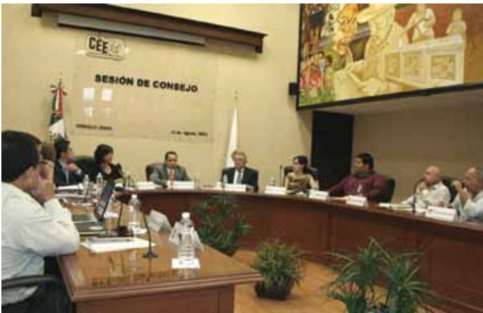
El Pleno del Consejo aprobó el acuerdo para la integración de las Comisiones Ordinarias.