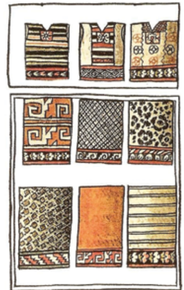
Diferentes tipos de textiles manufacturados por las mujeres. En la parte superior se observan huipiles (tipo de blusa) y la parte inferior enredos (pieza de tela que se enredaba en la parte baja del cuerpo a manera de falda). Códice Florentino.

La actividad textil era una labor manual para la cual se requería habilidad, destreza y dedicación, por tal motivo se puede considerar que por más consejos, castigos o empeño de parte de la madre en enseñar a sus hijas a producir textiles, debieron existir mujeres cuya habilidad o interés en el oficio fuera nula. De la misma manera tuvo que haber mujeres que por su habilidad destacaran más en una actividad que en otra o sólo intervenía en una parte del proceso de la creación de textiles. El desarrollo femenino referente a los textiles logró la creación de un cuerpo reconocido de especialista que llegaron a dominar hasta 19 técnicas de manufactura, permitiendo acceder al reconocimiento social de su grupo, sólo equiparado a las actividades de los guerreros.