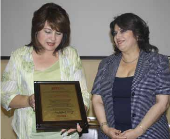
Es integrante del Consejo Consultivo del Instituto Sonorense de la Mujer y en fecha reciente recibió un reconocimiento de manos de la directora, Ma. Antonieta Meraz, por su vocación de servicio para promover la justicia y defensa de los derechos de las mujeres. En base a su desempeño intachable y su honorabilidad ha sabido ganarse el respeto dentro y fuera de la institución.

internacionales y en la normatividad que protege a la mujer, lo que no se está haciendo en ningún otro Estado del país.